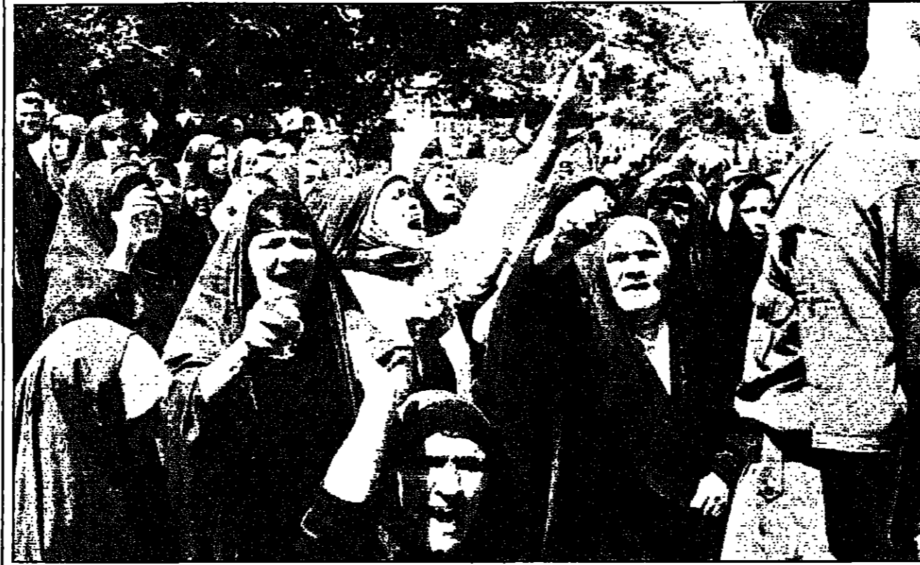
عراقيات تهنئ امام مكتب الامم للتحقق في بغداد اثناء تشيخ جنازة اطفالهم لاس

مصادر قالت انها ستعلن قريبا وستكون حاسمة عمان - «القدس العربي» جدد العراق اسس تعهده بالتحقق من قرارات جديدة ضد الامم للتحقق، مؤكدا ان قرار اعطائه بات ورضاه، وكالت الصنف العراقية من ان العراق اصبح طبق قوسين او اثنين من اتخاذ قرارات جديدة ضد الامم للتحقق اذ تبنى مجلس الامن قرارا بتعليق مراجعة القوات العراقية في العراق منذ ثمانية سنوات. وقالت صحيفة «البيان» التي يشراف عليها عدي صدام حسين النجل الاكبر للرئيس العراقي ان على مجلس الامن ان لا يكون وسيلة بيد السياسة الامريكية ويخضع لاعتبارات مشاعر العراق ومطالبه العادلة في تطبيق الفقرة 22 من القرار 687 الذي يخص في رفع الحظر النووي، ويناقش مجلس الامن مشروع قرار برفض عقوبات جديدة ضد العراق بسبب تطبيقه للتعاون مع مفتحي اللجنة الخاصة للامم للتحقق للكشف عن اسلحة الدمار الشامل العراقية (نوسيوك). وسبق لبيروت ان حذرت من انها ستستخذ وأجرات اخرى حاسمة لم توضح طبيعتها اذا تبنى مجلس الامن مشروع قرار بوقف الامم للتحقق وبريطانيا بتعليق المراجعة الدولية للقوات العراقية في العراق اذا لم يراجع من موقفه.